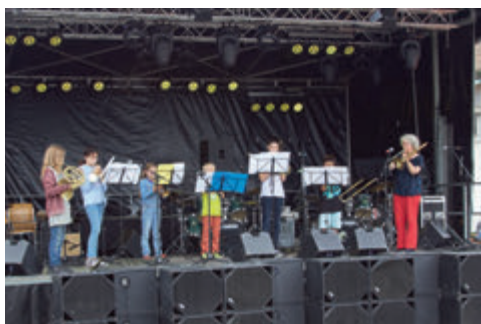
Die Messing Käfer