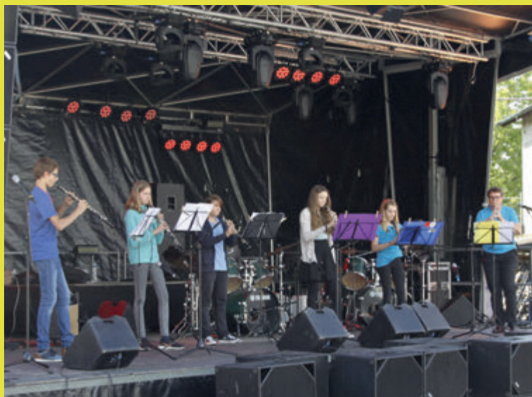
Die Oboenband beim ersten wydeOPENAIR.