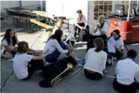
Warten auf den Auftritt