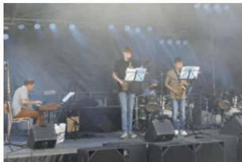
Die Music Planets