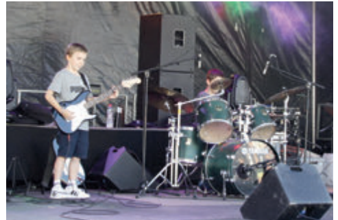
eGitarre und Schlagzeug