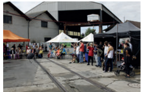
Teil des Publikums