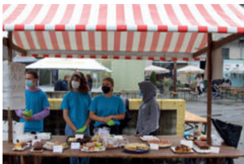
Kuchenstand der Sekundarschule