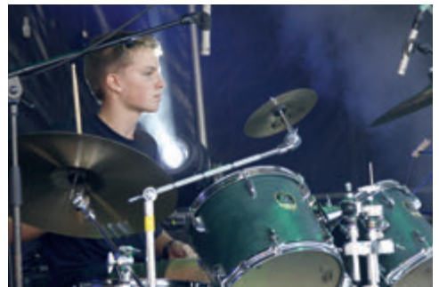
Schüler am Drum Set