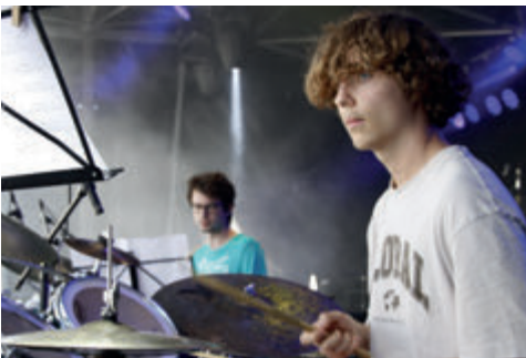
zwei junge Drummer