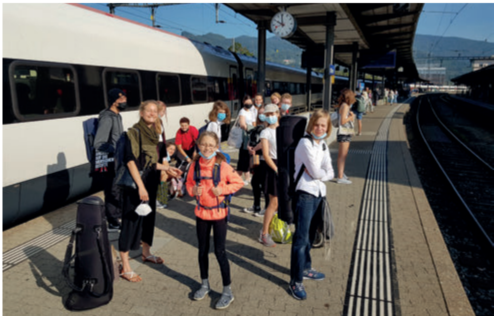
Umsteigen im Bahnhof Olten