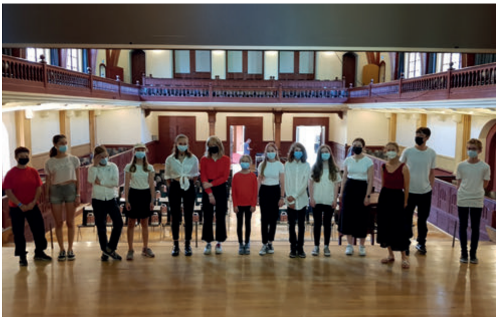
Auf der Bühne im Konzertsaal Solothurn